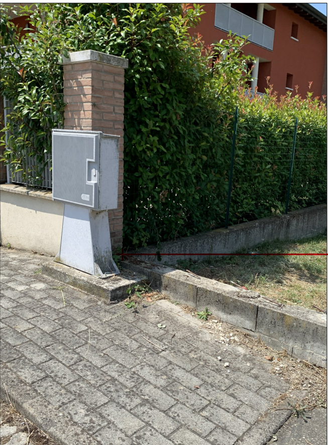
CAPOSALDO INDIVIDUATO SULLA MURA DI CONFINO IN ADERENZA AL PILASTRO DEL LOTTO LIMITROFO